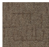
709 - Traffic