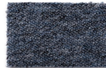
159 - Ilha do Mel