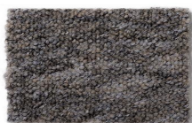
154 - Maragogi