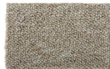
163 - Itaúnas