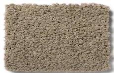
424 - Sépia