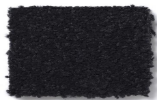
426 - Megane