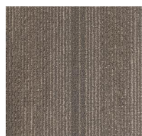
005 - Leo