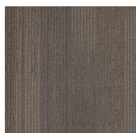
006 - Capricorn