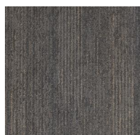
004 - Aquarius