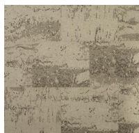
Forge - Beige