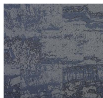
Forge - Navy