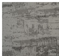
Forge - Grey