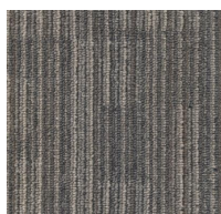
001 - Chip