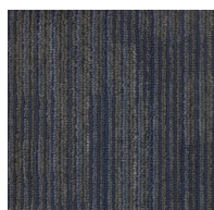
004 - Split