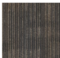
002 - Atom