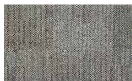
054 - Steel