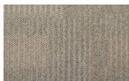
056 - Native