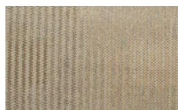
055 - Fancy