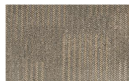
057 - Savana