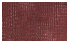
061 - Furnace