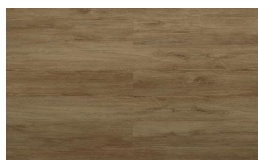
207 - KW 5104 - Victoria