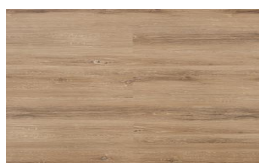
206 - KW 6063 - Oviedo