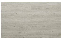
209 - KW 6154 - Maple