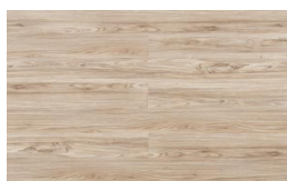
203 - KW 5011 - Alpino