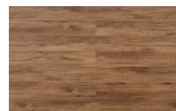
202 - KBW 8511 - Bruges