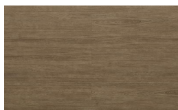
208 - KW 6071 - Malbec