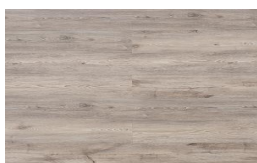
205 - KW 6051 - Pátina