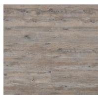
003 - KW 6022 - Olimpo