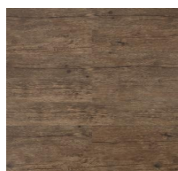
002 - KW 1404 - Shena