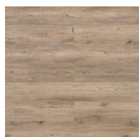
004 - KW 6053 - Bow