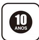
Selo de garantia de uso - Homogêneos